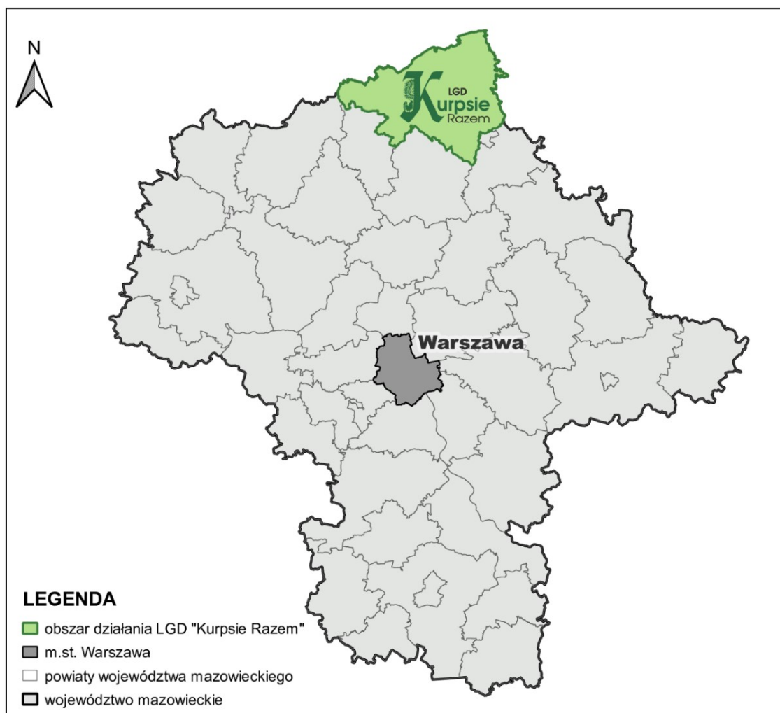
Mapa 1. Obszar LGD „Kurpsie Razem” na tle województwa mazowieckiego – opracowanie własne na podstawie danych GUGiK i darmowego programu QGIS

LGD „Kurpsie Razem” skupia obszar dziewięciu gmin kurpiowskich położonych w północnej części województwa mazowieckiego (Mapa 1.), które łączy tradycja i silna tożsamość kurpiowska. Wspólne korzenie i kultura sprawiają, że dużo łatwiej jest wymieniać się spostrzeżeniami i doświadczeniami oraz czerpać od siebie nawzajem pomysły i cenną wiedzę. LGD skupia wokół siebie ludzi mocno związanych z Kurpiowszczyzną i lokalną społecznością oraz nastawione jest na współpracę i partnerstwo we wszystkich działaniach, które przynoszą wymierne korzyści.