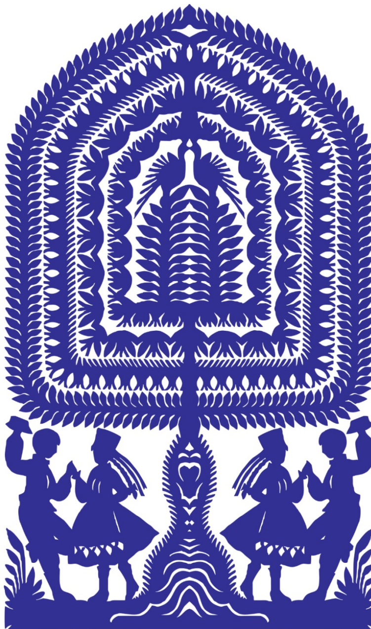
wycinanka kurpiowska – leluja